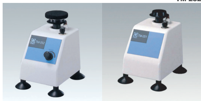
TM-252+平板アタッチメント