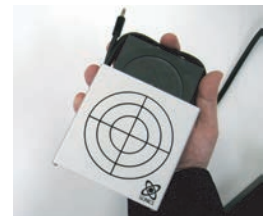
専用アダプター内部への MS-101N装着手順