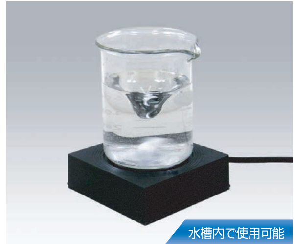
水槽内で使用可能