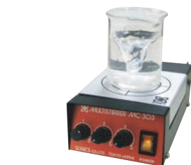
アダプター内へのスターラー装着運転時

MS-101Nを4台お使いになる際には、 コントローラー背部のジャック部へ3台接続、4台目をスタンドアダプター内 に取付け、コントローラー上部へ装着してご使用できます(赤矢印の順)。