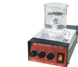
アダプター内へのスターラー装着運転時

4台お使いになる際には、 コントローラー背部のジャック部へ3台接続、4台目をスタンドアダプター内 に取付け、コントローラー上部へ装着してご使用できます(赤矢印の順)。