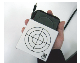
専用アダプター内部への MS-101N装着手順